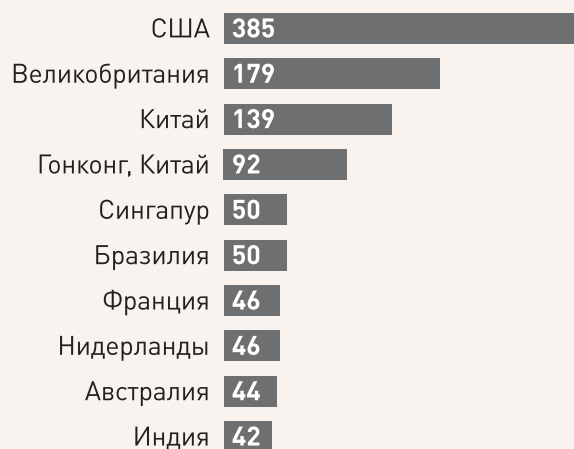
График 3. Оценка объема прямых иностранных инвестиций: топ-10 стран, 2016, млрд.долл. (получатели инвестиций).

офисам. Снизился объем инвестиций в Швейцарию (с 70 до 6 млрд.долл.), Бельгию (с 21 до 19 млрд.долл.) и Нидерланды (с 73 до 46 млрд.долл.). В то же время, Объем в Великобританию увеличился практически в 6 раз с 33 до 179 млрд.долл., что было вызвано направленной в страну волной мегасделок по слияниям и поглощениям.