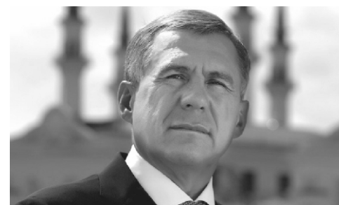
Вся Республика Татарстан в одном лице на ВЭФ-2017 в Давосе

В рамках давосских встреч проводится около 300 пленарных заседаний, семинаров и "круглых столов", а также "мини-встречи в верхах" с участием государственных деятелей. Здесь не принимаются резолюции или другие документы, но форум предоставляет возможность встретиться и обсудить в неформальной обстановке многие ключевые для мировой экономики вопросы, установить новые деловые контакты, провести неофициальные встречи с глазу на глаз и "без галстуков".