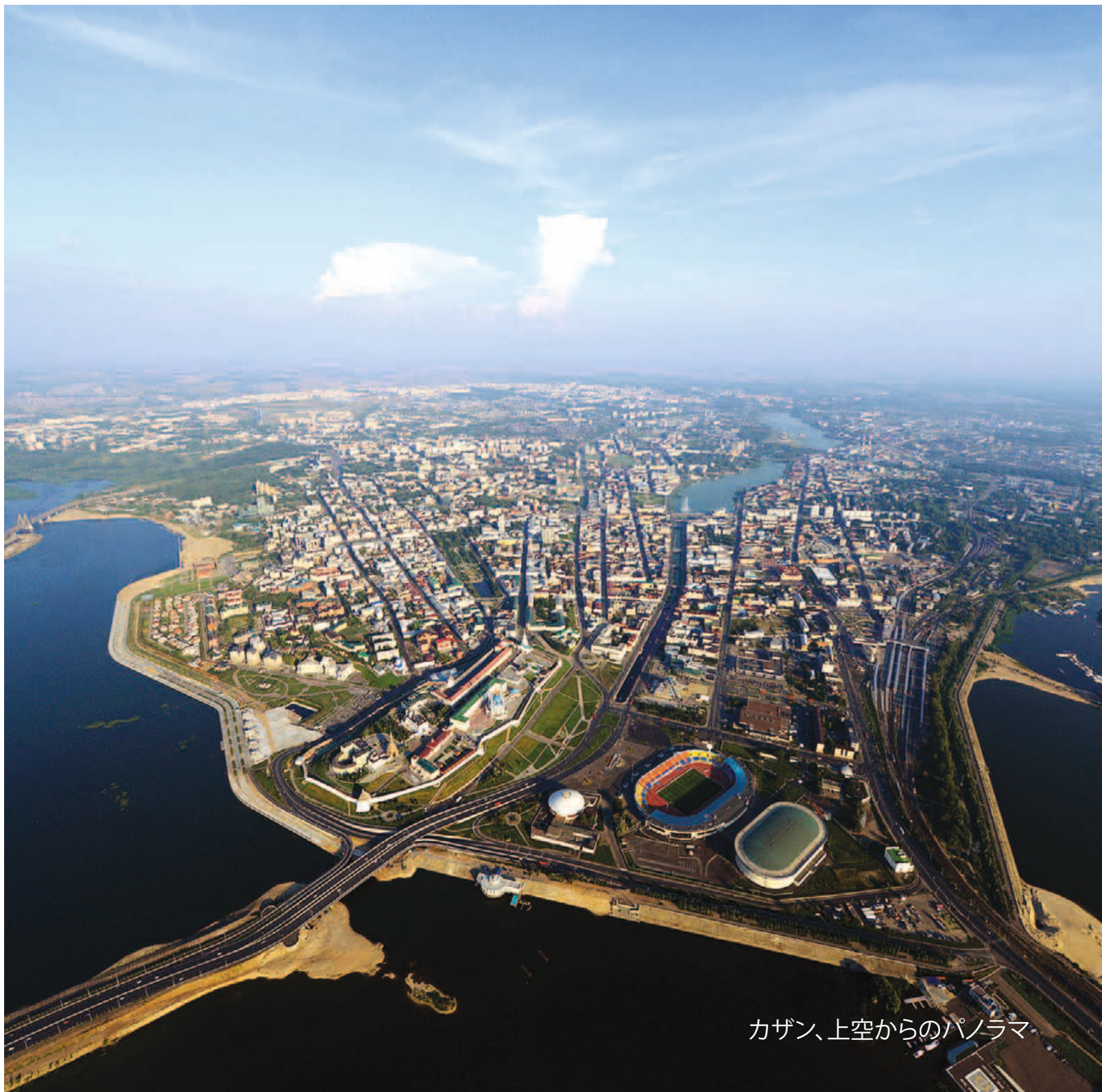
カザン、上空からのパノラマ