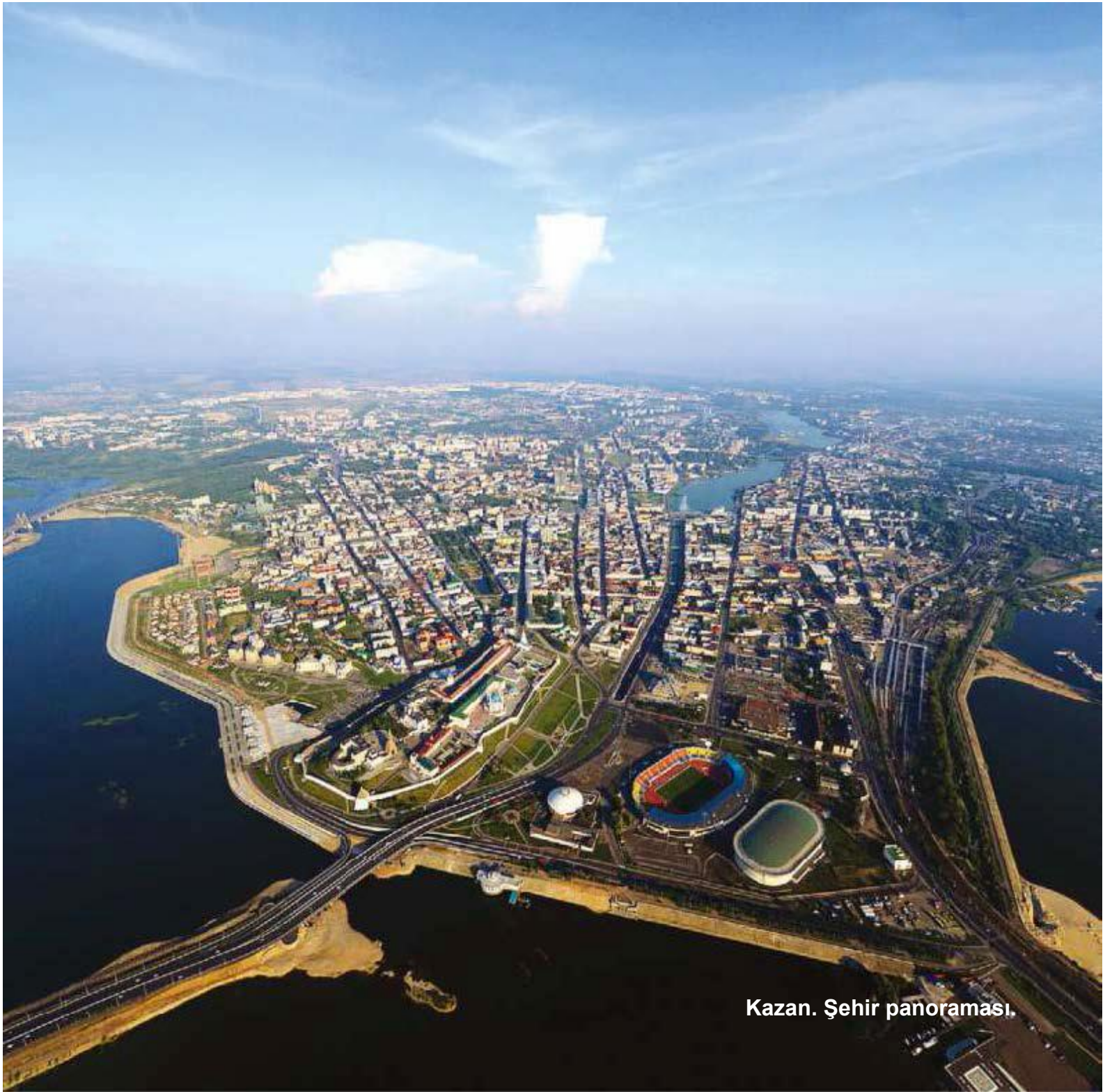
Kazan. Şehir panoraması.